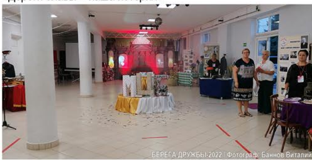
БЕРЕГА ДРУЖБЫ-2022

• Посещение военно-исторического мемориала «Самбекские высоты», участие в областных акциях «Мир без фашизма» и «Дороги славы – наша история»