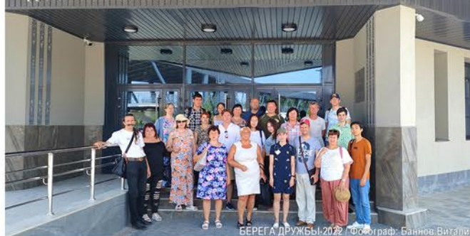
БЕРЕГА ДРУЖБЫ-2022

• Финалисты и наставники «Берегов дружбы» посетили мемориальный комплекс «Балка смерти» и Самбекские высоты.