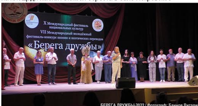
БЕРЕГА ДРУЖБЫ-2022

• Участие в Фестивале национальных культур «Берега дружбы» на площади имени Алексея береста в селе Покровское