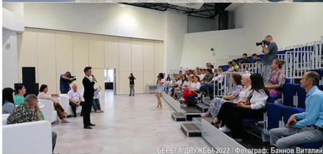
БЕРЕГА ДРУЖБЫ-2022

• Посещение военно-исторического мемориала «Самбекские высоты», участие в областных акциях «Мир без фашизма» и «Дороги славы – наша история»