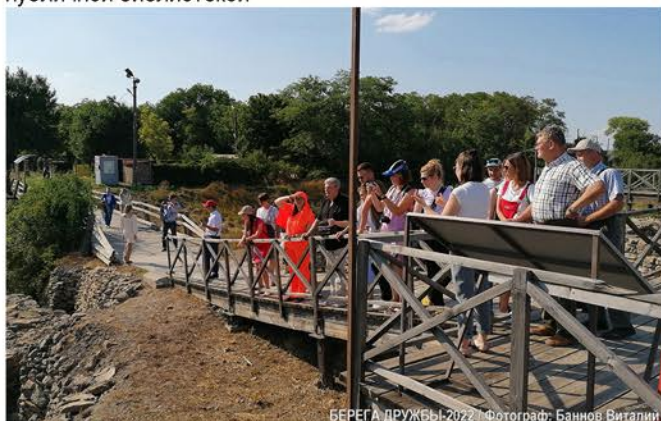
БЕРЕГА ДРУЖБЫ-2022

• Свободный микрофон для наставников и финалистов Фестиваля на площади перед Донской Государственной публичной библиотекой