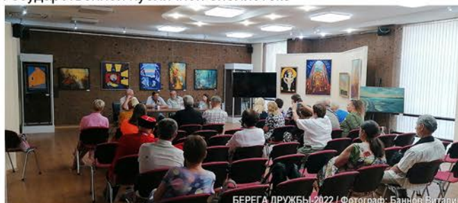
БЕРЕГА ДРУЖБЫ-2022

• Конкурсные слушания финалистов в Донской Государственной публичной библиотеке