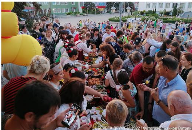
БЕРЕГА ДРУЖБЫ-2022

• Открытие выставки именных библиотек Неклиновского района, которым в разное время были присвоены имена местных авторов-современников и известных классиков литературы в рамках Международного проекта «Берега дружбы»