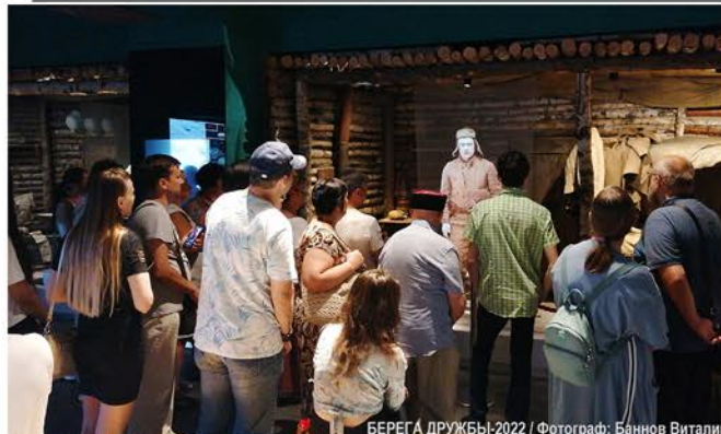
БЕРЕГА ДРУЖБЫ-2022

• в Петрушинском отделе им. И.П. Мележа прошел Районный (зональный) литературный этноперекрёсток «В семье народов России».