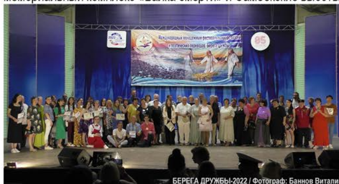
БЕРЕГА ДРУЖБЫ-2022

• Финалисты и наставники «Берегов дружбы» посетили мемориальный комплекс «Балка смерти» и Самбекские высоты.