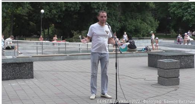
БЕРЕГА ДРУЖБЫ-2022

• Свободный микрофон для наставников и финалистов Фестиваля на площади перед Донской Государственной публичной библиотекой