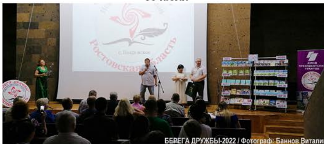
БЕРЕГА ДРУЖБЫ-2022

• Конкурсные слушания финалистов в Донской Государственной публичной библиотеке