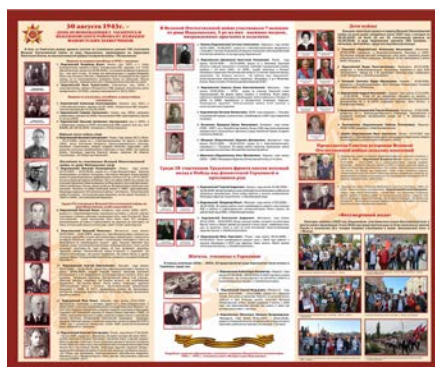
Фото Стенд музея рода Надолинских посвященный празднику «Дню освобождения Ростовской области от немецко-фашистских захватчиков»